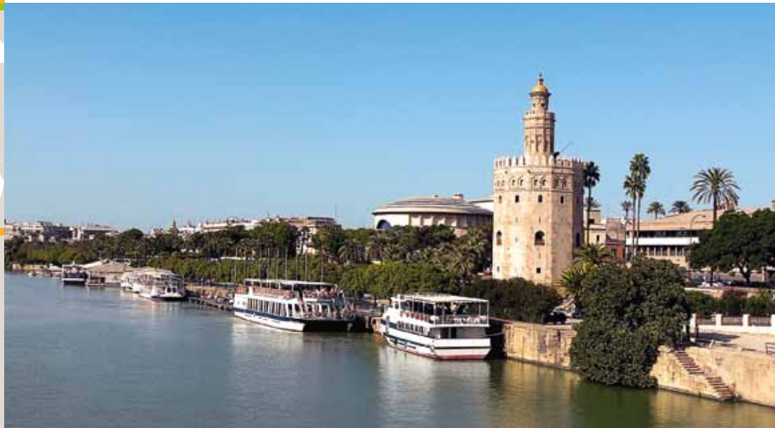
Sevilla / Seville