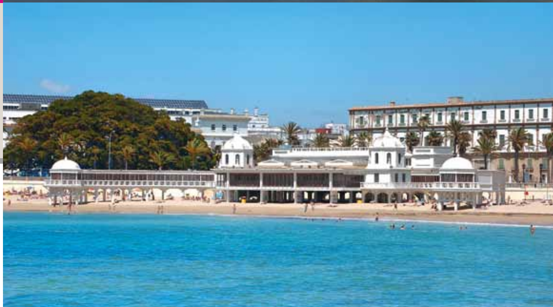
Cádiz / Cadiz